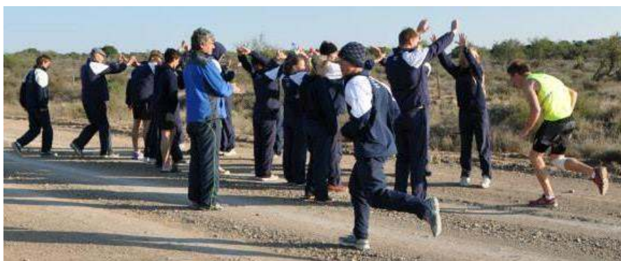
Tonneltjies het nog hulle ereplek – met die tradisionele laatkommers