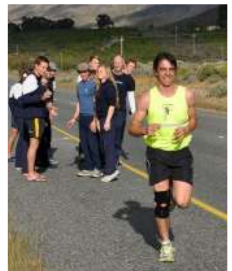
Stoffel in aksie