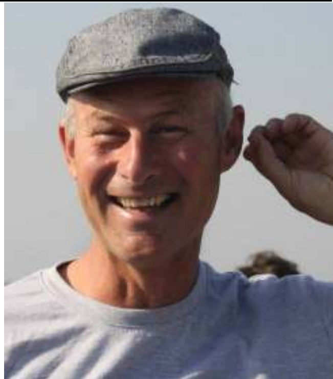
Die toerpa in sy element tydens die toer

“Die jongmense se oorgawe in geloof is treffend. Nie sonder vrae nie, maar hulle besluit om in die geloof te leef en dit met oorgawe te doen, laat ’n mens dink aan wat iemand gesê het: As ’n mens dit wat jy in die Bybel kan verstaan, doen, het jy nie genoeg tyd en energie om besig te wees met die dinge wat jy nie kan verstaan nie!