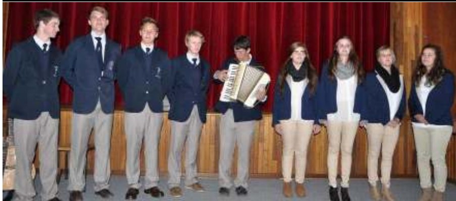
Die sanggroep in aksie tydens die toer